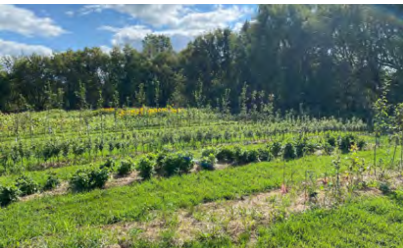
Culture de boutures d'arbres fruitiers au site de Sainte-Anne-de-la-Pérade.

rigoureuse d'un projet pour soutenir l'établissement de plusieurs productrices et producteurs dans ce milieu de vie fortement agricole. Le loyer demandé à ses locataires permet le démarrage et la croissance de projets qui auraient difficilement vu le jour dans le contexte actuel de surenchère des lots agricoles. Bien plus, la location à ces entreprises est ainsi assurée à long terme puisque la Fiducie n'est pas active dans le marché de la revente des terres agricoles.