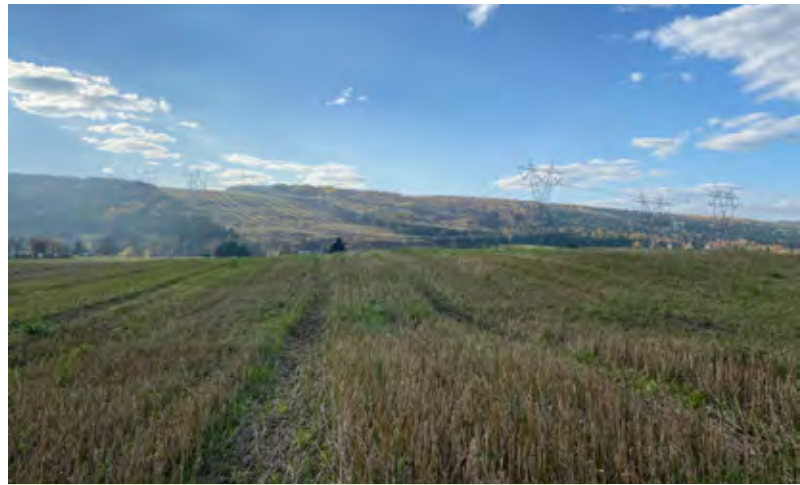
Champ de blé biologique au site de Baie-Saint-Paul.

Cette acquisition montre que ce ne sont pas uniquement les terres agricoles à proximité des grands centres urbains qui méritent une protection particulière. Celles qui définissent le paysage des communautés rurales le demandent tout autant.