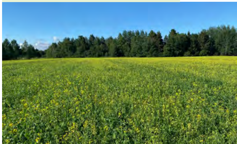
Champ de canola biologique au site d'Hébertville.

Cette propriété est cultivée selon les règles de l'agriculture biologique.