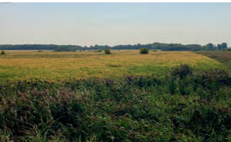
Champ de soya au site de Boucherville.

Le prix trop élevé des propriétés qui entraîne un loyer prohibitif, même pour la Fiducie, a été la principale cause d'achoppement dans ces dossiers.