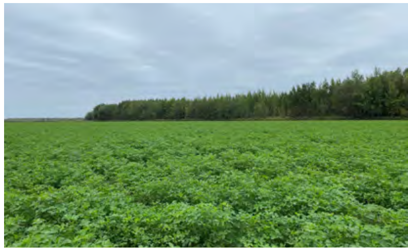
Engrais vert au site de Saint-Stanislas-de-Kostka.