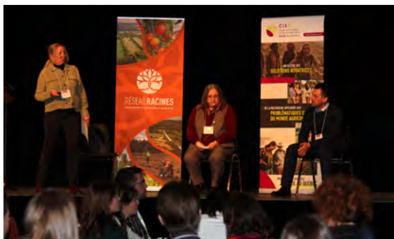
Présentation de la Fiducie au rendez-vous annuel du Réseau Racines.

Les fiducies d'utilité sociale agricoles continuent d'attirer l'attention des journalistes, et le travail de la Fiducie agricole UPA-Fondation a fait l'objet d'articles sur le site de Radio-Canada et les journaux La Terre de chez nous , Le Soleil et Le Quotidien du 12 janvier 2024, la radio CIHO Charlevoix 96,3 les 10 et 19 janvier 2024, l'émission